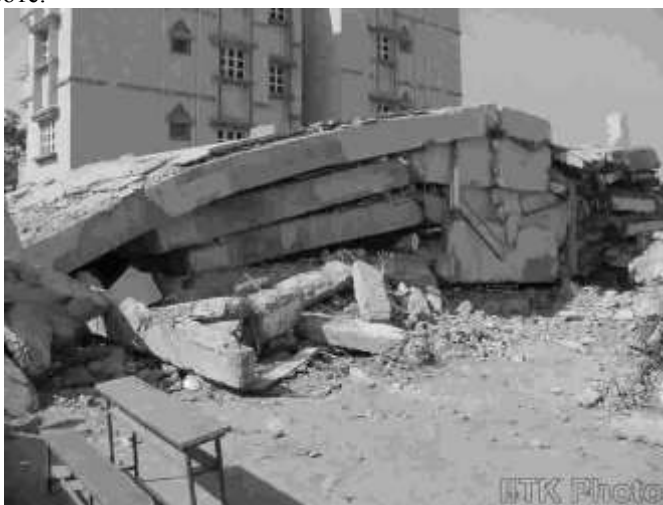
Рис. 1. Разрушение 4-х этажного Г-образного здания школы в городе Ахмедабад, Индия, 2001

сейсмостойкости регламентируют отступления от прямоугольной формы в плане (рис.3). На рис.4 приведены ограничения изменения здания по высоте.