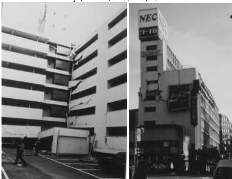
Рис. 2. Кобе, Япония, 1995