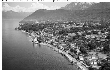
Рис.4.Спа курорт Эвиан. Франция.