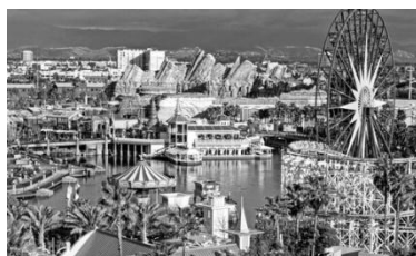
Рис.2.Тематический курорт Диснейленд. Франция.