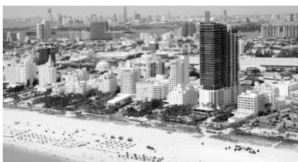
Рис.1.Пляжный курорт Майами. Флорида.

является целью прибытия. Зона отдыха, живописные места, игровые установки могут лишь дополнять его основные услуги. (7)