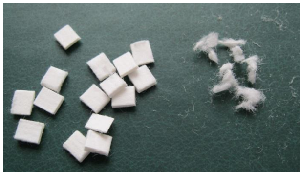
Рис. 1. Внешний вид чипов микрофибры UltraFiber 500

В качестве основных компонентов шлакощелочной газобетонной смеси использовались портландцемент ПЦ/П-Б-Ш М500, доменный молотый шлак, кремнеземистый компонент–зола-уноса ТЭЦ, ускоритель твердения, щелочной компонент, газообразователь – алюминиевая пудра. В качестве пластификатора использовали С-3. Армирующее волокно – целлюлозный полимер UltraFiber 500. Микрофибра представлена в виде чипов 5×6 мм и содержит более 33.000 волокон рис. 1. Чипы диспергируются в отдельные волокна при смешивании с цементной пастой.