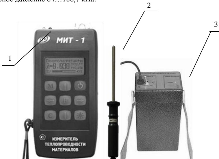
Рис. 2. Измеритель теплопроводности материалов «МИТ-1»: 1 – электронный блок; 2 - измерительный зонд; 3 - внешний источник питания

Прибор «МИТ-1» (рис. 2) состоит из электронного блока (1), измерительного зонда (2) и внешнего источника питания (3) с выходным напряжением 9В. На лицевой панели корпуса электронного блока расположены клавиатура и окно графического дисплея. Принцип действия прибора основан на измерении изменения температуры измерительного зонда за определенное время при его нагреве постоянной мощностью. Рабочие условия эксплуатации прибора таковы: диапазон температур -10...+40^{\circ}\text{C} , относительная влажность воздуха до 80%, атмосферное давление 84...106,7 кПа.