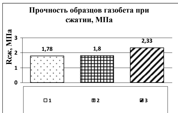
Рис. 4. Изменение предела прочности при сжатии газобетона в возрасте 28 суток: 1 – контрольные образцы газобетона, 2 – модифицированные образцы газобетона микрофиброй 900 г/м 3 , 3 – модифицированные образцы газобетона микрофиброй и 500 г/м 3 .

Показатели прочности газобетонных образцов составов 1, 2 и 3 в возрасте 28 суток представлено на рис. 4. Предел прочности при сжатии образцов газобетона состава 3 превышает на 30% по сравнению с контрольными образцами газобетона, что также подтверждается способностью микрофибры к упругим деформациям.