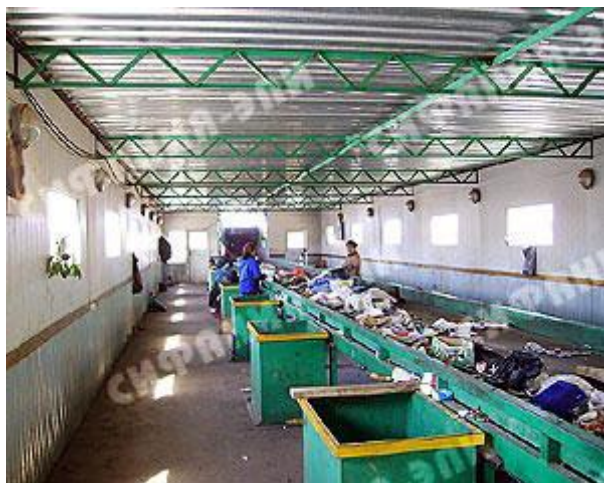
Рис. 2. Помещение сортировочной кабины с естественной вентиляцией

Устранить указанные недостатки можно путем устройства сети воздухопроводов (рис. 4.) [5]. Вытяжная сеть позволяет обеспечить вытяжку в требуемом объеме, однако не обеспечивает полноценного притока в помещение сортировки, также отсутствует система отопления.