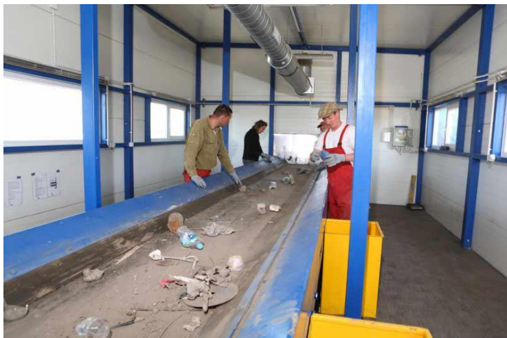
Рис. 4. Помещение сортировочной кабины с механической вентиляцией (сеть воздуховодов)

Очевидно, что для обеспечения круглогодичной работы сортировочного комплекса необходимо обеспечивать помещения сортировочных кабин современными системами микроклимата в состав которых необходимо включать системы приточной вентиляции которые должны непосредственно производить «душирование» рабочих мест (рис. 5). Вытяжная вентиляция должна выполняться в центре помещения над сортировочным конвейером.