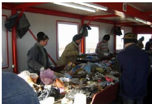
Рис. 3. Помещение сортировочной кабины с механической вентиляцией (осевыми вентиляторами).

Устранить указанные недостатки можно путем устройства сети воздухопроводов (рис. 4.) [5]. Вытяжная сеть позволяет обеспечить вытяжку в требуемом объеме, однако не обеспечивает полноценного притока в помещение сортировки, также отсутствует система отопления.