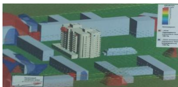
Рис. 4. Визуализация зоны ветрового подпора при северо-западном ветре

Однако при помощи ПК FlowVision выполнены расчеты зон повышенного и статического давлений вокруг рассматриваемого объекта при разных направлениях ветра (Таблицы 1-8, Рис. 4-11), которые показывают отсутствие зон повышенного давления в районе оголовков дымоходов 1-6, а соответственно и возможность беспрепятственно использовать газовое оборудование.