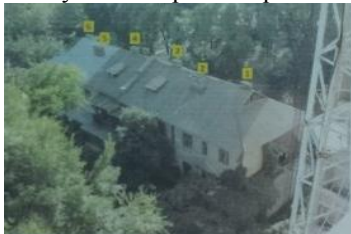
Рис. 2. Исследуемое здание, ул. Разумовского

Как пример использования данного программного комплекса в реальных условиях рассмотрим объект в г.Одесса.