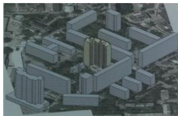
Рис. 3. Группа жилых домов в г.Одесса

Согласно нормативным документам - ДБН В.2.5.-20-2001 Приложение Ж15, дымоходы двухэтажного здания Рис. 2, находящегося в окружении более высокого соседнего здания Рис. 3 попадают в зону ветрового подпора.