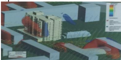
Рис. 8. Визуализация зоны ветрового подпора при северном ветре

Результаты расчета показывают что повышенное и статическое давление в районе оголовков дымоходов при западном ветре в пределах норм.