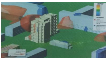
Рис. 7. Визуализация зоны ветрового подпора при западном ветре

Результаты расчета показывают что повышенное и статическое давление в районе оголовков дымоходов при северо-восточном ветре в пределах норм.