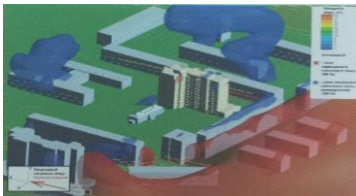
Рис. 6. Визуализация зоны ветрового подпора при северо-восточном ветре