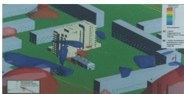
Рис. 5. Визуализация зоны ветрового подпора при юго-восточном ветре

Результаты расчета показывают что повышенное и статическое давление в районе оголовков дымоходов при северо-западном ветре в пределах норм.