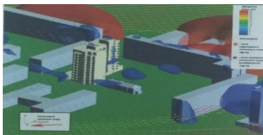
Рис. 10. Визуализация зоны ветрового подпора при восточном ветре