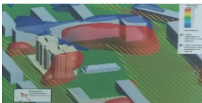
Рис. 9. Визуализация зоны ветрового подпора при юго-западном ветре

Результаты расчета показывают что повышенное и статическое давление в районе оголовков дымоходов при северном ветре в пределах норм.