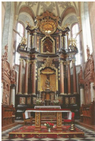
Рис. 4. Вівтар костелу Св. Лаврентія

Що стосується Римо-Католицьких храмів, то в опорядженні інтер'єрів переважає оздоблення стін мармуром, вітражами, скульптурними композиціями, горельєфами, картинами, або вставками монументального живопису.