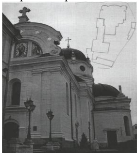
Рис.2 Церква Пресвятого Серця Христового

Пресвітерія, що знаходиться в апсиді католицького храму, є втіленням усього небесного, райського у сакральній споруді. Він належить до небесної зони самого храму. Тут, як правило, зображають фігури Богоматері або Христа.