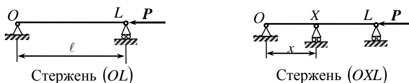
Рис. 1. К пояснению принятых обозначений

Результаты исследования. Используем обозначения: (MN) – однопролетный стержень, шарнирно опертый по концам M и N на абсолютно жесткие опоры, P(MN) – его основная KpC , (MXN) – двухпролетный стержень, образованный из (MN) введением промежуточной шарнирной опоры X (рис. 1).