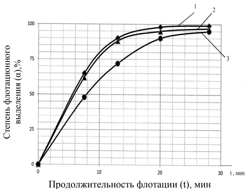
Рис. 2. Кинетика флотационного выделения дисперсной фазы нефти (1), минерального масла (2) и мазута (3) из их 0,75%-ных водных эмульсий, содержащих добавку 0,1 г/л ГИПХ –3А; рН среды – 6,5

благоприятных для флотационного выделения нефтепродуктов, что позволяет с максимальной эффективностью проводить данный процесс в нейтральной среде.