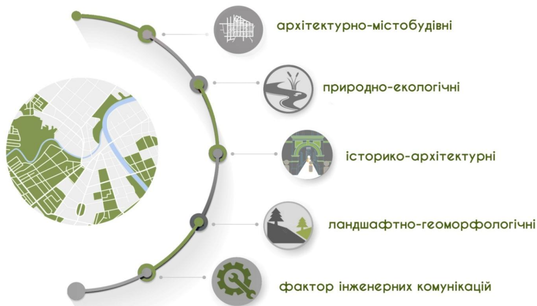
Рис. 1. Фактори впливу на вибір території для проектування ДРЦ

1. Архітектурно-містобудівні – структура населеного пункту, взаємозв'язок з мережею закладів даного типу, необхідна форма та площа ділянки під проектування, що виходить з проектного рішення, необхідної місткості та величини споруди.