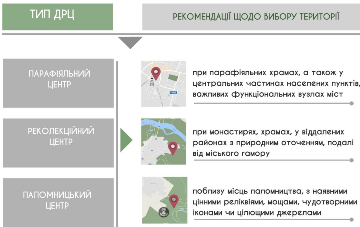
Рис. 2. Вплив містобудівного фактору на архітектурно-планувальну та містобудівну організацію ДРЦ