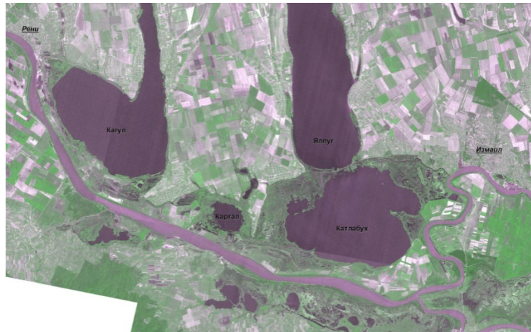
а - карта Австро-венгерской Империи (1889 г.), б - карта капитана Спратта «Дельта Дуная» (1856 г.), в – спутниковый снимок (2007 г.). 1