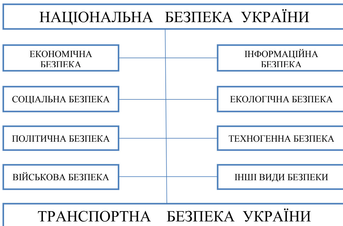
Рис.1. Місце транспортної безпеки в загальній системі національної безпеки

Варто відзначити, що транспортна безпека характеризується ієрархічністю, яка визначається великим ступенем впливу на її стан різних факторів внутрішнього і зовнішнього середовища, а також діями керуючої системи у вигляді міжнародних морських організацій, держави і громадських організацій в різних областях (і, звичайно, в законодавчій). Тому важливе значення має класифікація видів транспортної безпеки, що дозволяє здійснювати вибір конкретної політики та стратегії її забезпечення. І навіть, незважаючи на досить умовний характер будь-якої класифікації, яка зазвичай розробляється відповідно до тих чи інших практичних завдань, в її основу необхідно закладати найбільш суттєві загальні ознаки.