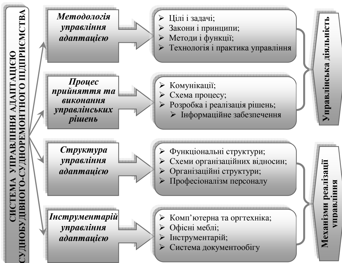
Рис. 2. Система адаптивного управління СБСР підприємством

Адаптивне управління судноремонтним-суднобудівним підприємством можна представити у наступному вигляді (рис.2), де кожний елемент об'єднується в систему [6]. Методологія та процес прийняття та виконання рішення формують управлінську діяльність, а структура та інструментарій - механізм реалізації управління.