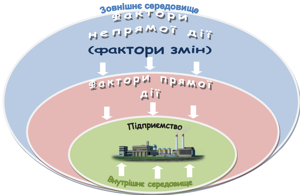
Рис. 3. Система взаємодії між підприємством та зовнішнім і внутрішнім середовищем

Метою діагностики є виявлення найбільш важливих проблем і пріоритетів ведення господарської діяльності для розробки програми короткострокових і довгострокових заходів, які дозволять поліпшити ефективність та фінансові показники діяльності підприємства.