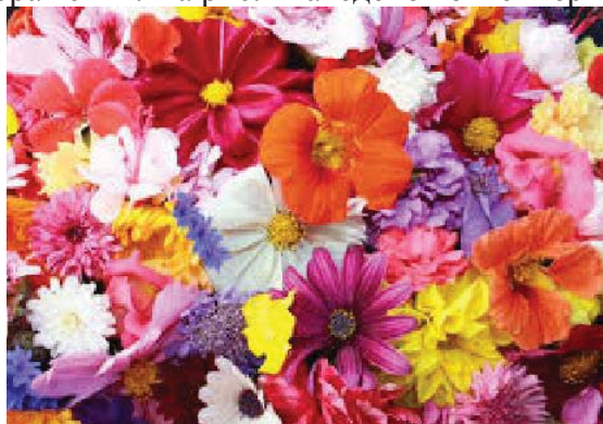
Рис.2. Контейнер

Далі наводяться тільки зображення. На рис.2 наведено контейнер