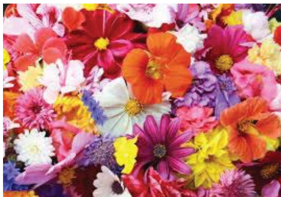
Рис.4. Стеганографічний контейнер

Контейнер, що містить повідомлення, наведено на рис.4.