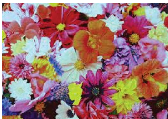
Рис.6. Стеганографічний контейнер

Контейнер, що містить повідомлення, наведено на рис.6.