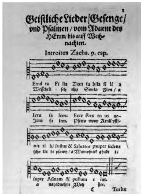
Ил. 3. Лужицкая книга духовных песнопений. — В кн.: Нижнелужицкий сборник псалмов и Катехизис (Бауцен, 1574)