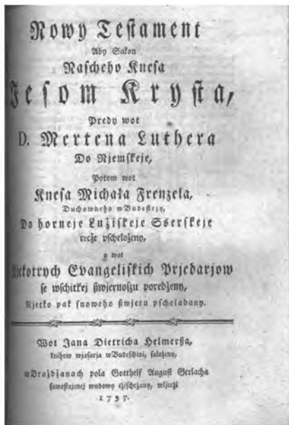
Ил. 4. Новый Завет..., переведенный д. Мартином Лютером на немецкий язык, а затем на верхнелужицкий Михаилом Френцелем (Бауцен, 1797)