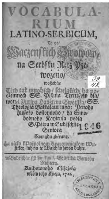
Ил. 8. Словарь латино-сербский... Ю. Светлика (Бауцен, 1721)