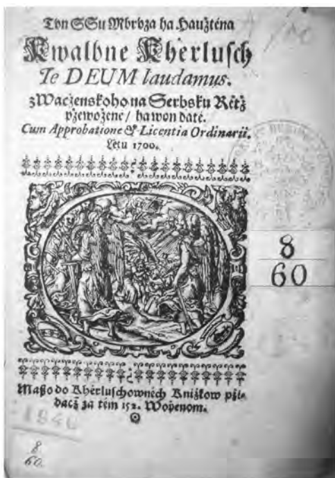
Ил. 7. Текст песнопений «Тебя, Бога, хвалим» ([1700])