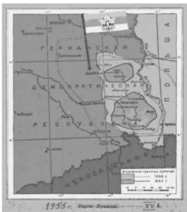
Ил. 1. Карта расселения лужицких сербов в 1886 и 1952 гг.

Подводя итоги проведенного исследования, подчеркнем, что Анджей Кухарский был не первым путешественником по славянским землям, однако, результаты его поездок имеют огромное значение для изучения славянской культуры. Книжное собрание А. Кухарского богато библиографическими редкостями и представляет собой огромный интерес как историко-культурный памятник прошлых столетий. Коллекция представлена изданиями, разнообразными по тематике, языковой принадлежности, в которых отражено развитие славянской истории более чем трех столетий. Данный книжный комплекс включает ценные материалы, которые могут стать основой для изучения богатого культурного наследия лужицких сербов.