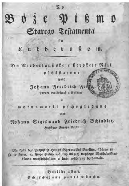
Ил. 5. Святое писание Старого Завета за Лютером... на нижнелужицкий язык переведенное Й. Шиндлером (Берлин, 1824)