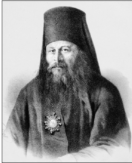
Ил. 2. Иннокентий (Борисов И. А.)

(ил. 2) в 1853 г. составил примерную программу епархиального издания, которая вследствие Крымской войны осталась без рассмотрения. Уже после смерти владыки, его преемник архиепископ Херсонский и Одесский Димитрий (Муретов К. И.) (ил. 3) в 1859 г. представил эту программу на рассмотрение Святейшего Правительственного Синода.