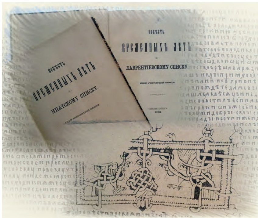
Ил. 3. Видання «Повісті временних літ», здійснене Імператорською Археографічною комісією.