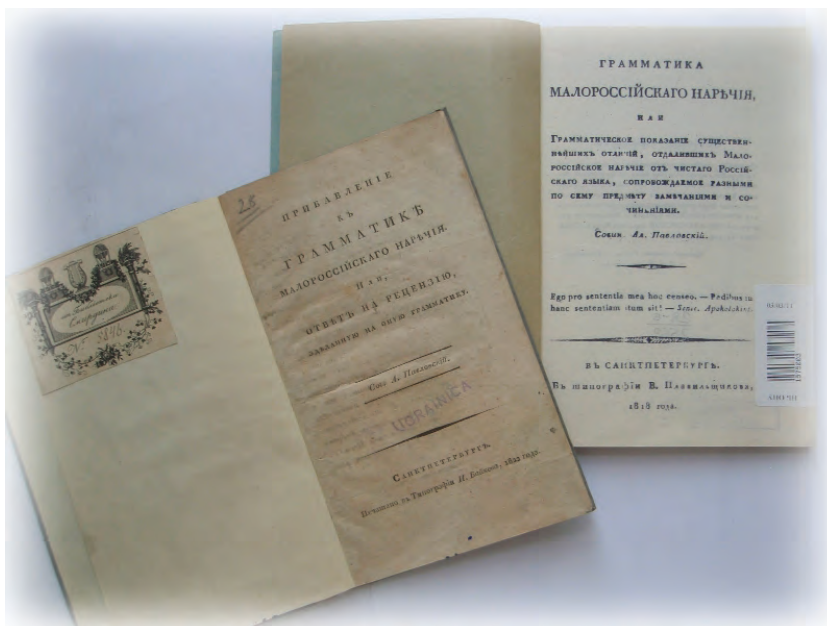
Лл. 12. Факсимільне видання «Граматики малоросійського нарччія...» та «Прибавление к Грамматике...» О. Павловського.