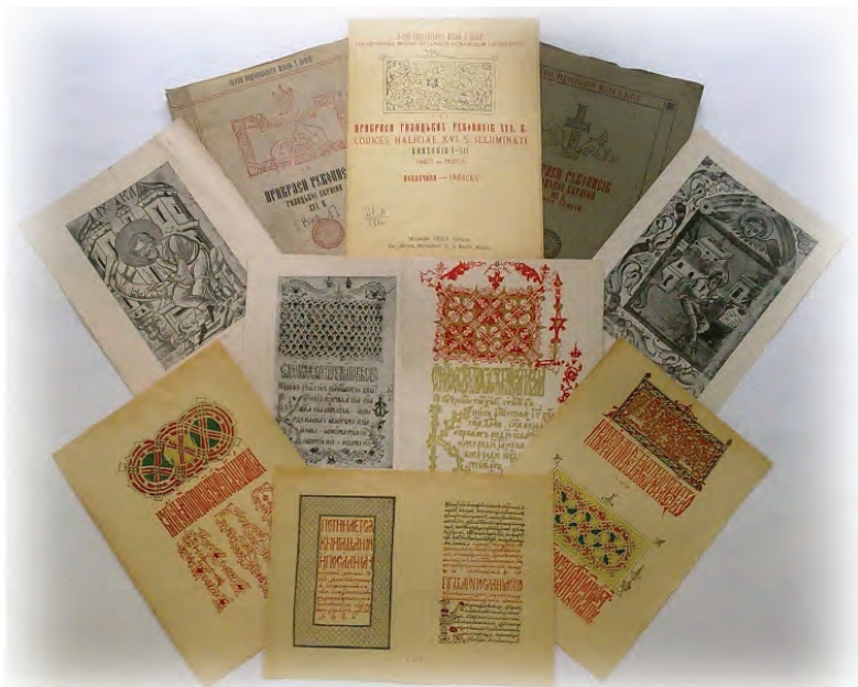
Лл. 14. «Прикраси галицьких рукописів XVI в.» І. Свенціцького.