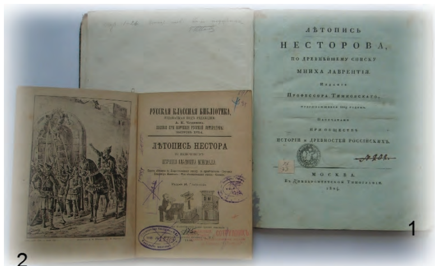
Іл. 2. 1) Перше видання «Повісті временних літ», здійснене Товариством історії та старожитностей російських при Московському університеті; 2) Видання «Повісті временних літ» з серії «Русская классная библиотека» під редакцією О. М. Чудинова.