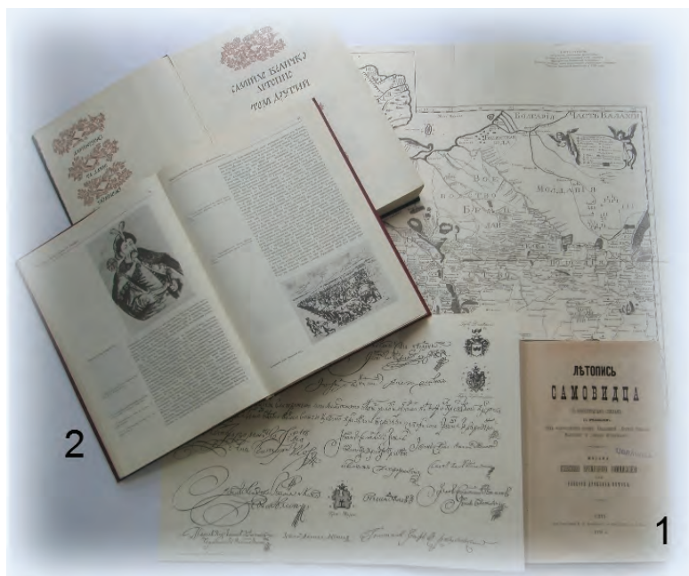
Іл. 9. Козацькі літописи у фондах НБ: 1) «Літопис Самовидця», виданий Київською Археографічною комісією; 2) Перший науковий переклад «Літопису Самійла Величка» українською мовою.