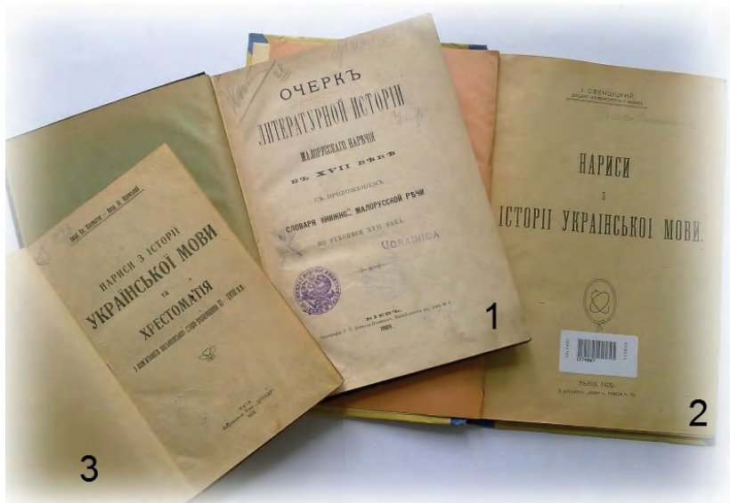
Лл. 13. Студії з історії української мови: 1) «Очеркъ литературной исторіи малорусскаго наречія в XVII вѣкѣ с приложением словаря книжной малорусской речи по рукописи XVII вѣка» П. Житецького; 2) «Нариси з історії української мови» І. Свенціцького; 3) «Нариси з історії української мови та Хрестоматія з пам'ятників письменської старо-українчини XI-XVIII вв.» О. Шахматова та А. Кримського.