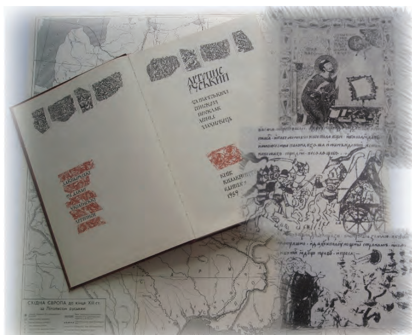
Іл. 8. Перший документальний науково-академічний переклад «Літопису руського» українською мовою.