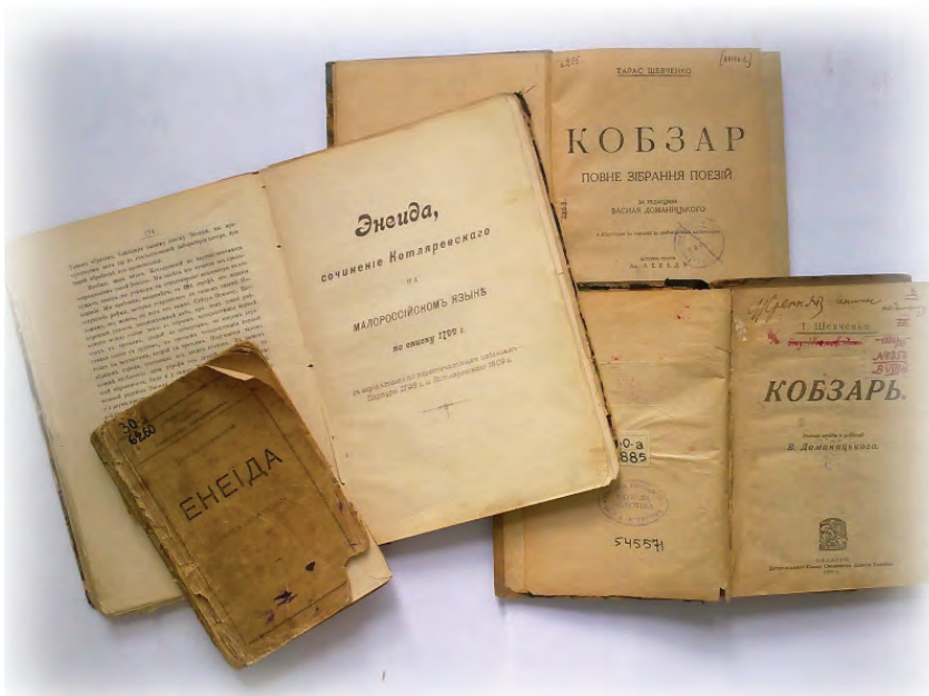
Лл. 11. Видання «Енеїди» І. Котляревського, здійснене П. Житецьким, та «Кобзаря» Т. Шевченка, під редакцією В. Доманицького.