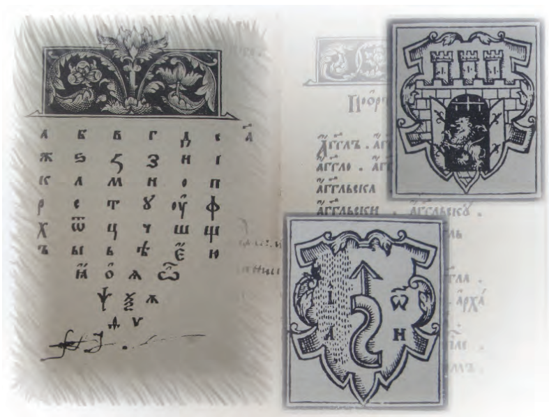
Іл. 10. Фотомеханічне видання «Букваря» І. Федорова: кириличний алфавіт та зображення герба м. Львова з друкарським знаком І. Федорова.