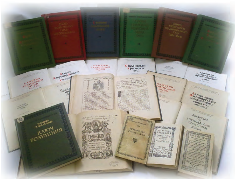
Іл. 15. Серія «Пам'ятки української мови» у фондах Наукової бібліотеки.