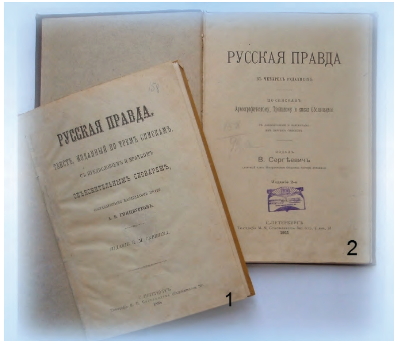
Іл. 5. «Руська Правда» у фондах Наукової бібліотеки: видання А. Гінцбурга та В. Сергєєвича.