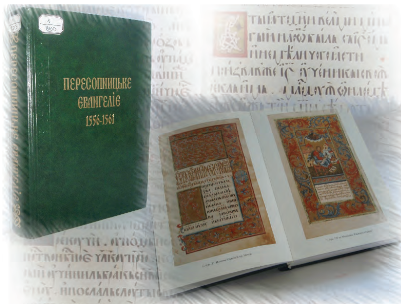
Іл. 7. Перше повне факсимільне видання Пересопницького Євангелія.