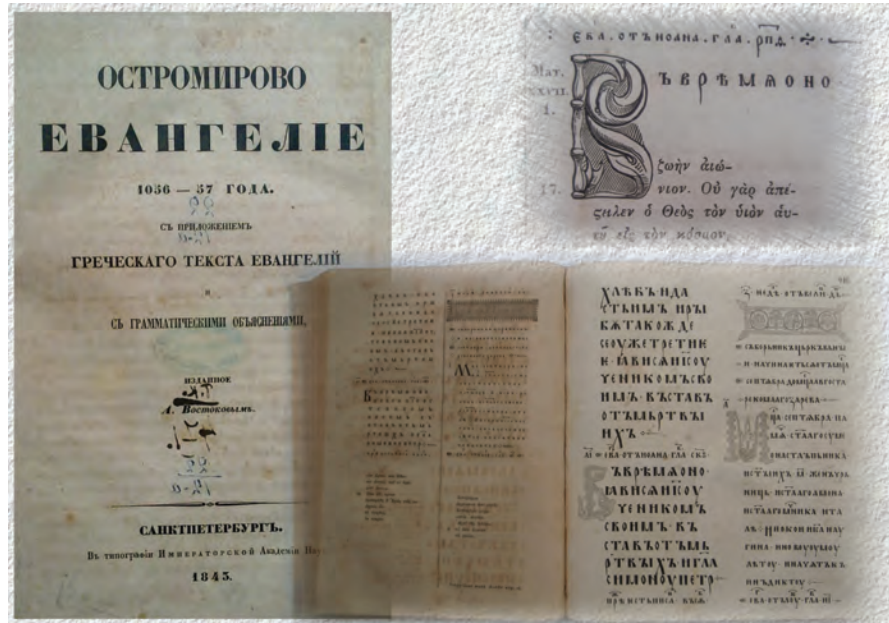
Іл. 1. Перше наукове видання Остромирового Євангелія, здійснене О. Х. Востоковим.