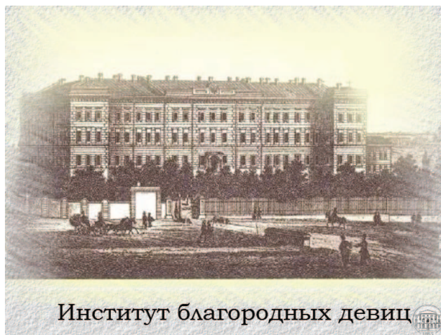
Институт благородных девиц

С 1874 г. по определению Херсонского епархиального начальства П. В. Йодко был утвержден по совместительству епархиальным архитектором (Приложение 6). В этом же году он смог построить на Старопортофранковской улице собственный дом. Ранее архитектор проживал сначала в служебной квартире во флигеле университетского дома на Преображенской улице, а в 1873 г. переехал в подвальное помещение главного корпуса университета, где занимал две комнаты, одна из которых была отведена под «чертежную».