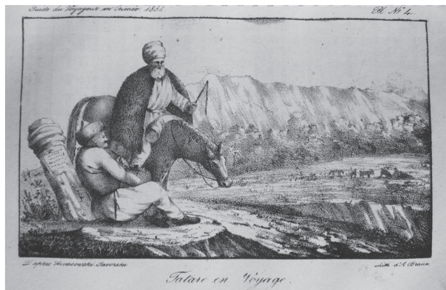
Рис. 3. Литография «Путешествующий татарин» работы Яворского по рисунку И. К. Айвазовского