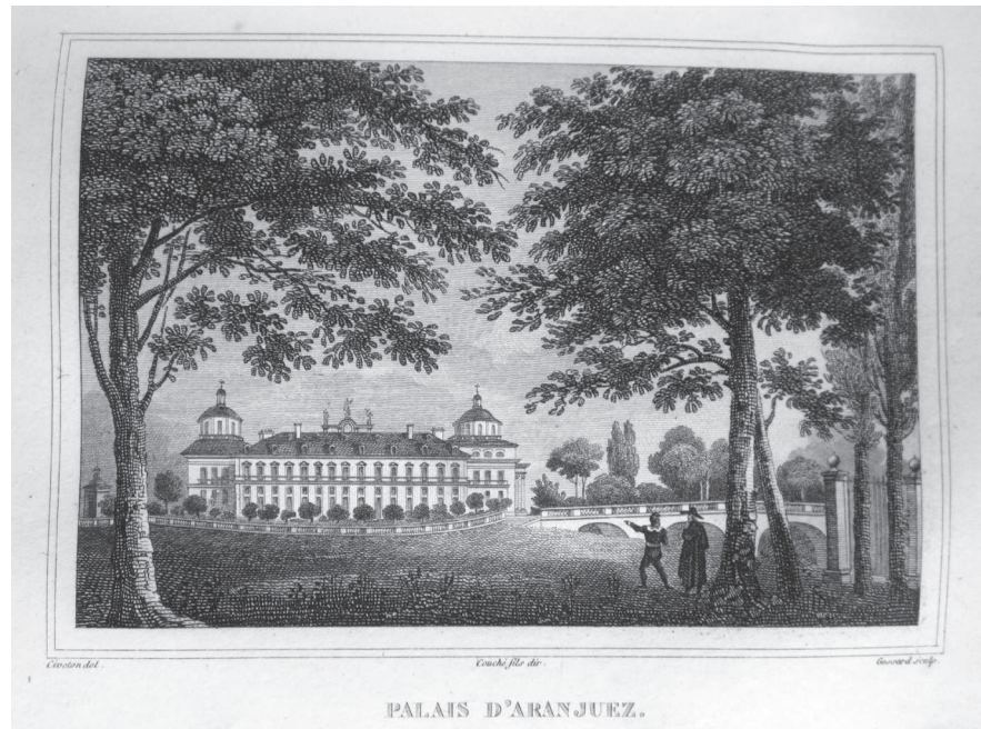
Рис. 2. Гравюра «Дворец в Аранхуэсе» работы Фрасуа Луи Куше и Госсарда по рисунку Кристофа Циветона