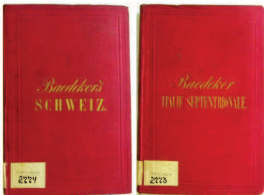
Рис. 5. К. Бедекер «Швейцария: справочник для туристов ...» (Кобленц, 1853) К. Бедекер «Северная Италия до Ниццы, Генуи и Болоньи: руководство для путешественника» (Кобленц, 1863)