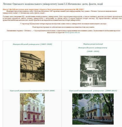
Ил. 3. «Літопис Одеського національного університету імені І. І. Мечникова: дати, факти, події» (Одеса, 2015)

что все отделы библиотеки выполняют элементы научной работы. Более близки информационно-библиографическому отделу в этом плане два подразделения библиотеки: отдел редкой книги и рукописей и отдел научной обработки и каталогизации. Именно с этими отделами в последнее время мы тесно сотрудничаем в научной работе 3 (ил. 3, 4).