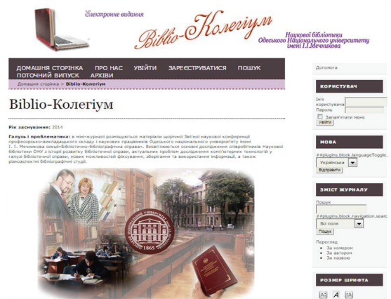
Ил. 4. «Biblio-Kolegium» [Електронне видання]: міні-журнал.