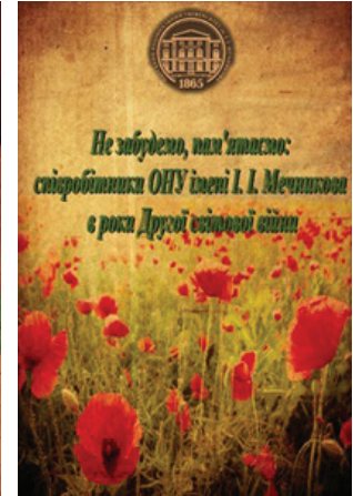
Ил. 2. «Не забудемо, пам'ятаємо: співробітники ОНУ імені І. І. Мечникова в роки Другої світової війни» (Одеса, 2015)

что все отделы библиотеки выполняют элементы научной работы. Более близки информационно-библиографическому отделу в этом плане два подразделения библиотеки: отдел редкой книги и рукописей и отдел научной обработки и каталогизации. Именно с этими отделами в последнее время мы тесно сотрудничаем в научной работе 3 (ил. 3, 4).