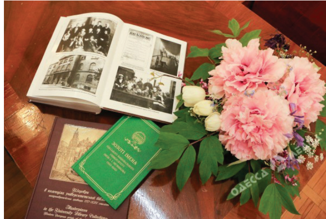
Ил. 1. «Золоті імена Одеського національного університету імені І. І. Мечникова (1865-2015): наук. довідник» (Одеса, 2015)