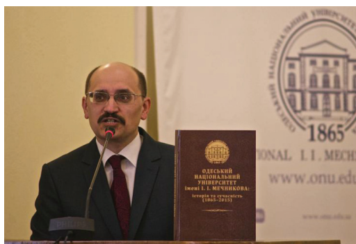
Ил. 6. «Одесский национальный университет имени И. И. Мечникова. История та сучасність (1865-2015)» (Одесса, 2015)