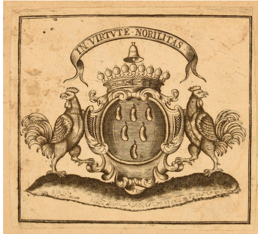
Ил. 4 (Приложение 2, № 4)