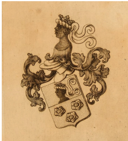
Ил. 2 (Приложение 2, № 2)