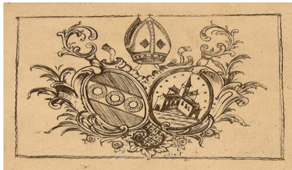
Ил. 3 (Приложение 2, № 3)