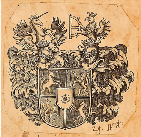
Ил. 1 (Приложение 2, № 1)