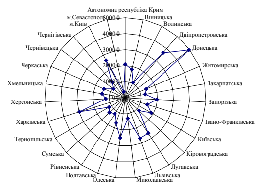
Рис. 1. Графічне бачення чисельності наявного населення у регіонах України у 2000 році [2]

У наявного населення по Україні у 2000 році складала 49429,8 тис. осіб. Найбільша чисельність наявного населення у Донецькій області (4953,4 тис. осіб), Дніпропетровській області (3662,6 тис. осіб), Харківській області (2965,9 тис. осіб), Львівська область (2676,9 тис. осіб). Найменша –