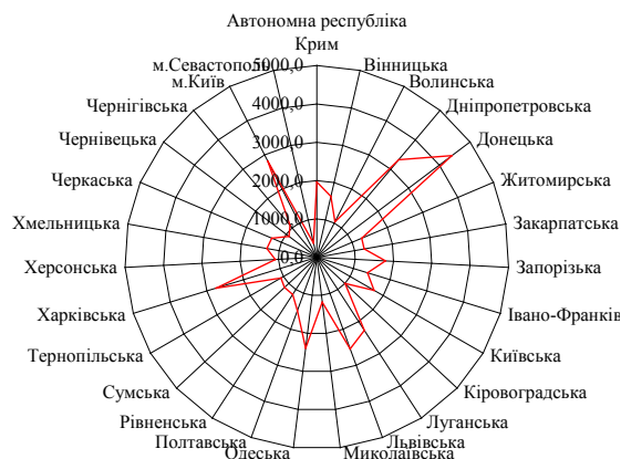
Рис. 2. Графічне бачення чисельності наявного населення у регіонах України у 2012 році [2]

у Чернівецькій області (932,3 тис. осіб), Волинській області (1067,7 тис. осіб), Тернопільській області (1156,9 тис. осіб).