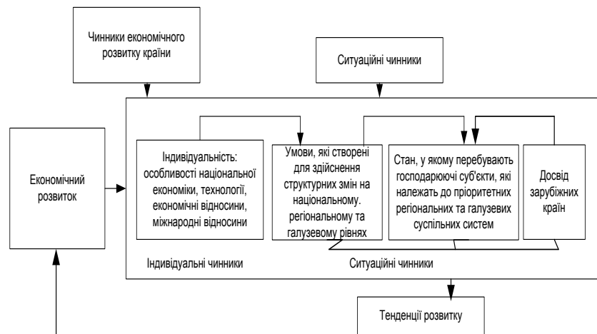
Рисунок 1. Принципова схема ситуаційного підходу до структурних перетворень у економіці [сформовано автором]

Таким чином, структурна перебудова в Україні – надзвичайно складна проблема, яка вимагає розроблення методологічних засад її проведення в умовах вітчизняної економіки, на основі розгляду таких елементів: 1) виділення особливостей національної економіки, показників її функціонування у поточному періоді; 2) визначення умов, які у поточному періоді створені для вирішення структурних проблем на національному, регіональному та галузевому рівнях; 3) дослідження стану, в якому перебувають підприємства, які належать пріоритетних регіональних та галузевих суспільних систем, що вимагають структурних змін; 4) вивчення іноземного досвіду удосконалення структури промисловості. На рис. 1 представлена принципова схема використання ситуаційного підходу до вирішення структурних питань у економіці.