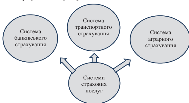
Рис. 1. Системи страхових послуг для суб'єктів аграрної сфери

Виклад основного матеріалу. В процесі еволюції страхування розроблено більше трьохсот популярних страхових продуктів. В Україні можна відмітити відсутність системного підходу при формуванні страхової політики держави. Поняття «системи» походить від давньо-грецького «συστήμα» (дослівно «сполучення») – це множина взаємопов'язаних елементів, відокремлена від середовища і яка взаємодіє з ним, як ціле [1, с. 30]. Згідно з Ю.І. Черняком, система – це відображення у свідомості суб'єкта (дослідника, спостерігача) властивостей об'єктів та їх відношень у вирішенні завдання дослідження, пізнання. [2, с. 55] На сьогодні в Україні сформувалися декілька популярних систем страхових послуг. Серед них: система банківського страхування, система автострахування та система аграрного страхування.