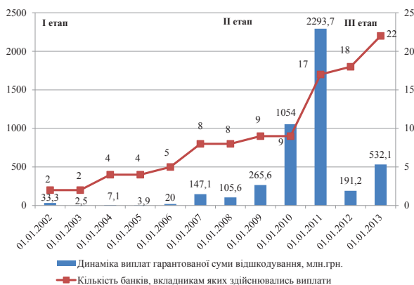
Рис. 4. Динаміка виплат та кількості банків, вкладникам яких здійснювались виплати

Подібним чином змінюються і показники виплат за зобов'язаннями банків, що перебувають на стадії ліквідації чи введено тимчасову адміністрацію (рис. 4). Після суттєвого зростання виплат у 2008-2011 рр., систему гарантування вкладів фізичних осіб в Україні було реформовано, завдяки чому, при зростанні кількості учасників системи, зберігається низький рівень виплат. Через масові банкрутства банків у кризові роки, відбулось ускладнення зв'язків системи, перерозподіл регуляторних повноважень та поява нового напрямку роботи Фонду гарантування вкладів фізичних осіб – управління проблемними активами.