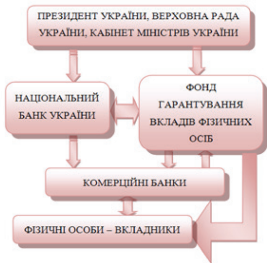
Рис. 2. Структура системи гарантування вкладів фізичних осіб

Суб'єктами системи гарантування вкладів є загальнодержавні регуляторні інституції, Фонд, Національний банк України, банки та вкладники (рис.2). Законодавчі та виконавчі органи влади формують інституційне середовище системи, визначаючи нормативні та правові обмеження – так звані «правила гри». Вітчизняна система може бути віднесена до імперативних [7, с. 146] чи обов'язкових [10, с. 152] систем страхування внесків і передбачає створення особливого державного чи підконтрольного державі органу (Фонду), а також обов'язкову участь у системі комерційних банків. Крім того органи державної влади визначають обсяги та структуру джерел фінансування Фонду гарантування вкладів фізичних осіб. Таким чином, державні інституції чинять як прями, так і опосередкований регуляторний вплив на функціонування системи гарантування вкладів.