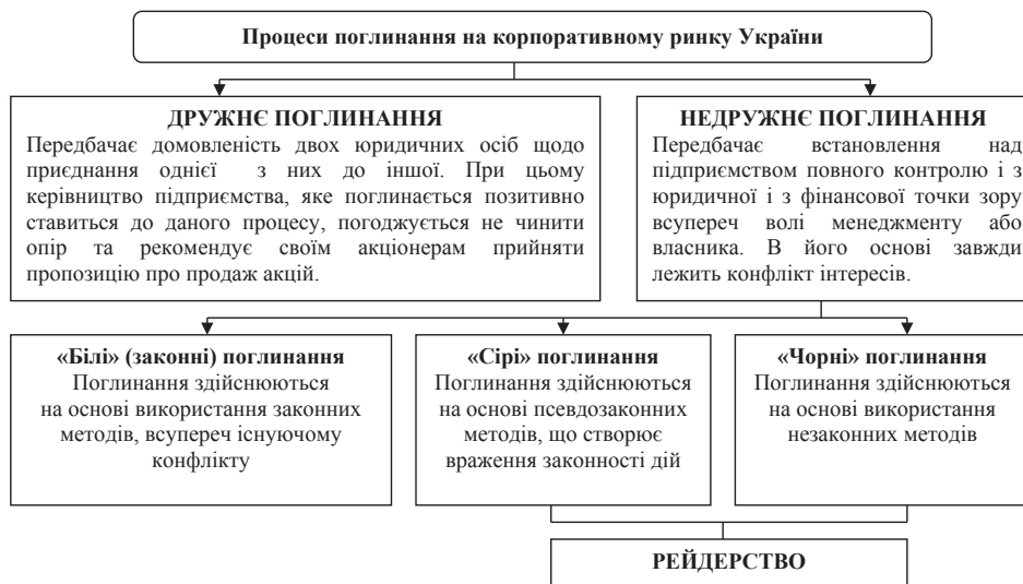
Рис. 2. Види операцій поглинання на корпоративному ринку України