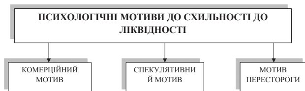
Рис. 2. Психологічні мотиви схильності до ліквідності за Дж. М. Кейнсом [2]

Виходячи із закону переваги і ліквідності, Дж. М. Кейнс схильність до ліквідності визначив трьома психологічними мотивами, що відображає (рис. 2).