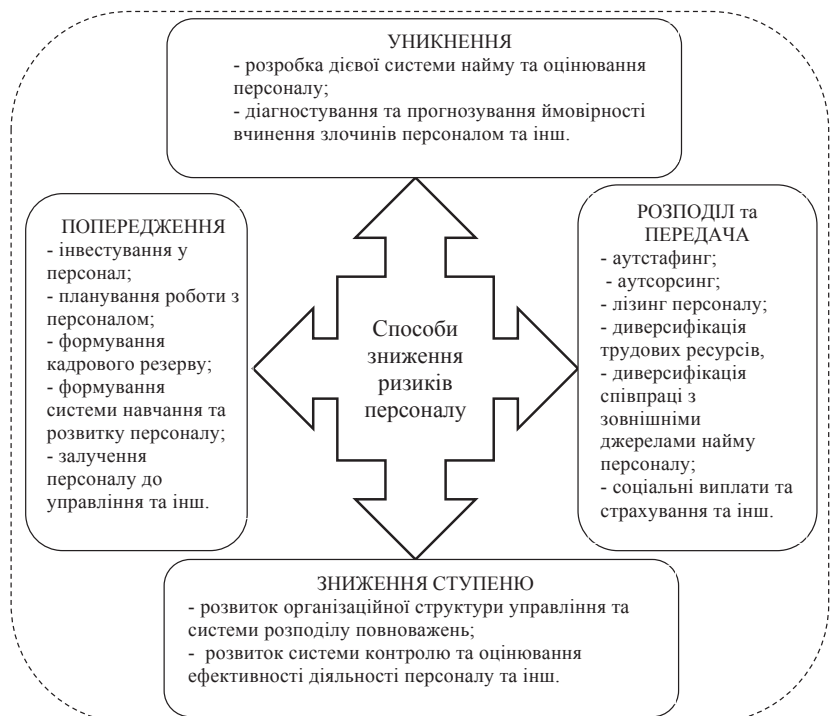
Рис. 2. Способи зниження ризиків персоналу