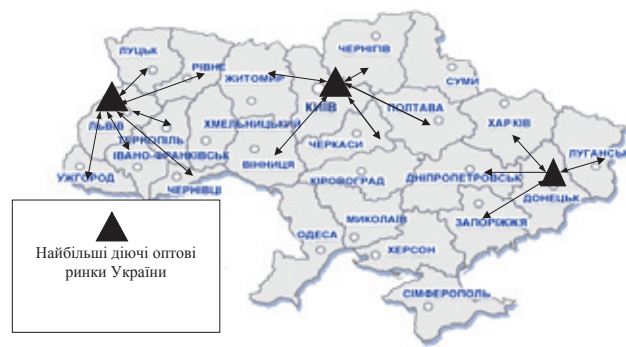
Рис. 2. Оптимальні шляхи надходження продукції на оптові ринки та відповідні напрями її реалізації

За офіційними даними, в областях України вирощується набагато більше овочів і фруктів, ніж споживається. Велику її кількість слід реалізовувати за межами областей (рис. 2).