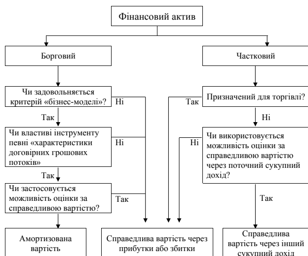
Рис. 2. Алгоритм оцінки фінансових активів

Усі фінансові активи, що є частковими інвестиціями, оцінюються за справедливою вартістю або через інший сукупний дохід або через прибутки і збитки. Такий вибір компанія може зробити відносно кожного інструменту, за винятком часткових інвестицій, призначених для торгівлі, які повинні оцінюватися за справедливою вартістю через прибутки або збитки. Алгоритм оцінки фінансових активів наведено на рисунку 2.