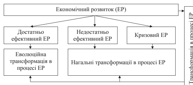
Рис. 3. Характер трансформації в процесі економічного розвитку

Важливо також виділити види трансформацій в процесі економічного розвитку (рис. 4).