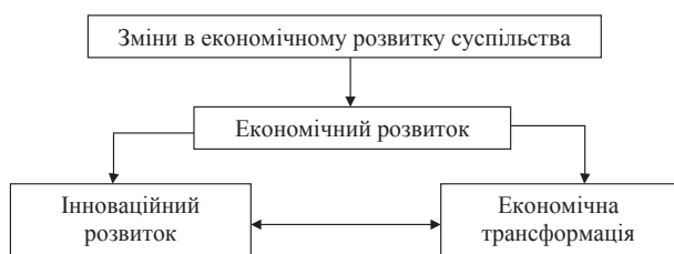
Рис. 2. Взаємозв'язок категорій «економічний розвиток», «інноваційний розвиток» та «економічна трансформація»

З нашого погляду, інноваційний розвиток – це зміни. І трансформація – це зміни. Однак між ними є відмінність (рис. 2).