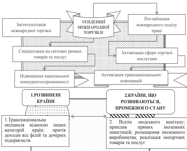
Рис. 3. Структурно-логічна схема впливу транснаціоналізації на глобальні гео економічні трансформації*

На нашу думку, виокремлення певних груп країн за декларованими ними парадигмами та суспільно-економічними формаціями може сприяти аналізу передумов регулювання гео економічних трансформацій на глобальному рівні. Це дозволить виявити, за допомогою яких важелів країни, що використовують різні методологічні підходи, змінюють гео економічний простір, виокремити головних інтеграторів світової економіки та спрогнозувати системоутворюючі інструменти впливу на країни, що мають перехідну структуру економічної моделі [4-6].