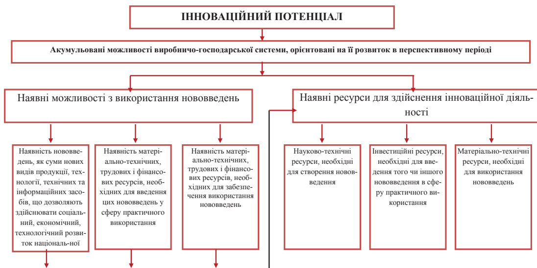
Рис. 2. Інноваційний потенціал як акумульовані можливості виробничо-господарської системи, орієнтованої на розвиток

його рівні: I рівень, що характеризує наявність ресурсів у підприємства, необхідних для інноваційної діяльності; II рівень, що характеризує фактори інноваційної активності підприємства (можливість, готовність, здатність).