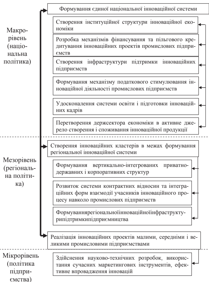
Рис. 1. Рівні інноваційної системи промислового підприємства

З іншого боку, сектор прикладної науки не може постійно орієнтуватися на потенційні замовлення виробництва. У цьому зв'язку він сам по-