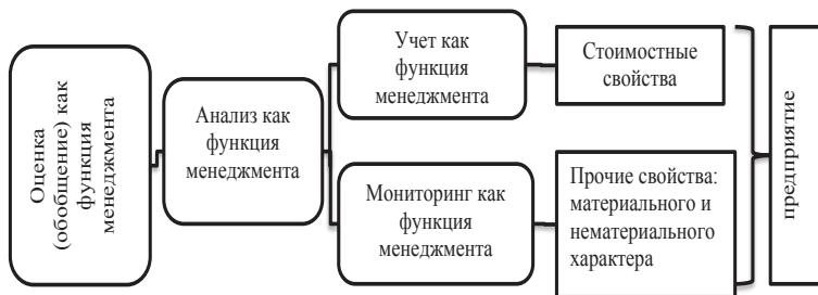
Рис. 2. Взаимосвязь функций управления в единой функции «восприятие»

Возвращаясь к функциям А. Черча, следует признать, что он первым обосновал выделение «рецептивной части» системы управления – в нашем понимании – «восприятие». Хотя в эту «рецептивную часть» он включал и частично функции контроля – сравнение со стандартом (планом).