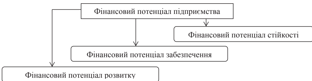
Рис. 2. Складові фінансового потенціалу підприємства