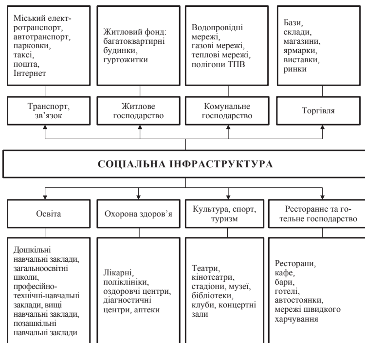
Рис. 1. Складові соціальної інфраструктури