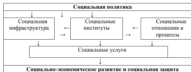
Рис. 1. Составляющие социальной сферы

Изложение основного материала. Обобщение существующих подходов к трактовке социальной сферы позволяет определить ее как комплексную систему по оказанию общественно значимых социальных услуг (в области здравоохранения, образования и науки, социальной защиты и социального обеспечения, духовного и физического развития), которые непосредственно определяют возможности человеческого развития, уровень и качество жизни населения, а также соответствуют историческим стандартам общества [1, с. 173-180]. Предложенное определение социальной сферы объединяет как экономический, так и социологический подходы, представленные в работах представителей отечественных научных школ [2, с. 87-98], поскольку очевидно, что предоставление социальных услуг невозможно без существования соответствующей инфраструктуры, регулирующих институтов и сопровождается формированием отношений, возникающих в процессе оказания услуг (рис. 1).