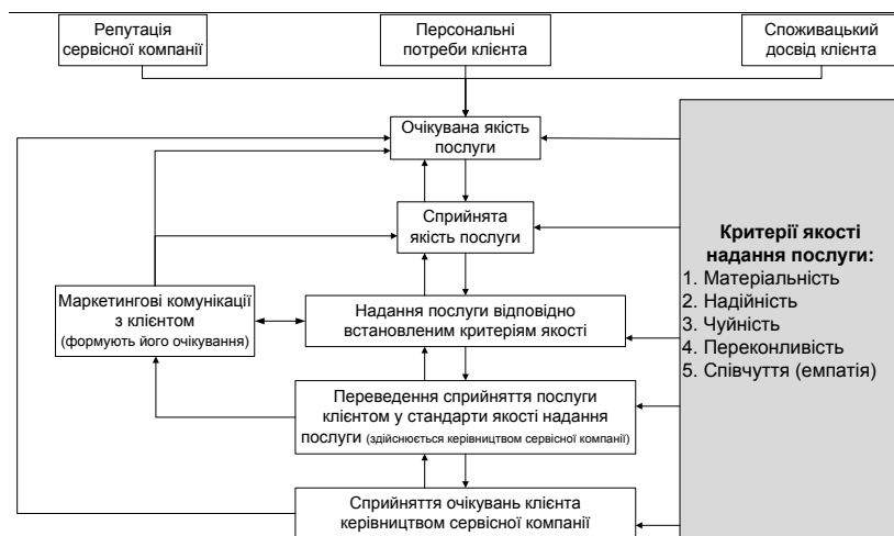
Рис. 1.3. П'ятирівнева GAP-модель якості послуг

Таким чином, оцінювання може здійснюватися лише в контексті конкретних ринкових завдань, що постають перед конкретними страховими компаніями, державними регуляторами страхових галузей і