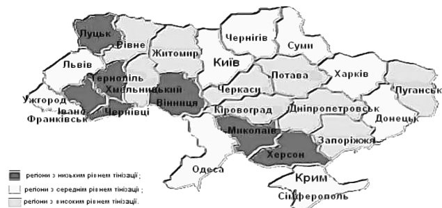
Рис. 1. Територіальна концентрація тіньових процесів за регіонами України у 2008 р. [4, с. 8]

політики держави і базою для регулювання розвитку регіонів. Для України компаративна типологізація сьогодні є особливо актуальною. Вона дозволяє ідентифікувати ознаки та критерії визначення проблемних регіонів. Однією з перших спроб групування регіонів за ознаками прояву процесів тінізації регіонів України було дослідження Мушинської Н. Ю., у якому автор запропонувала карту тінізації регіонів нашої країни у 2008 р. (рис. 1), яка базується на оцінках ймовірнісного підходу, суть якого викладена нижче.