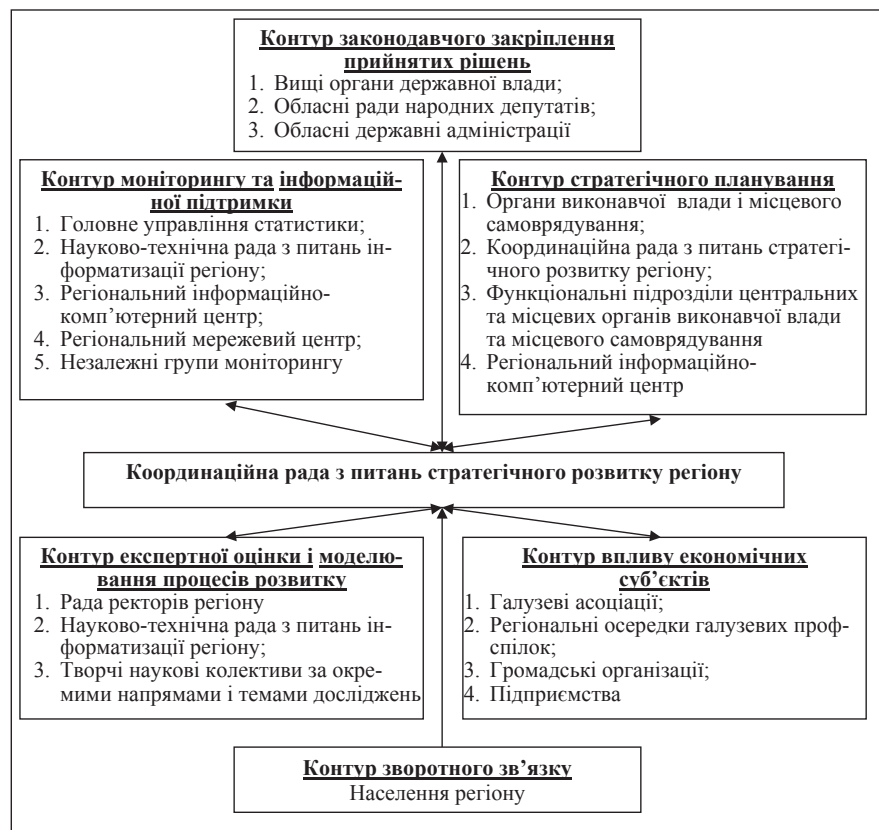
Рис. 2. Системно-технологічна, організаційна модель управління розвитком регіонального економічного простору

Інноваційність економіки та безпосередній зв'язок науки і виробництва виступають одними з головних факторів розвитку в умовах постіндустріального розвитку. Ефективному впровадженню наукових розробок у процес управління еконо-