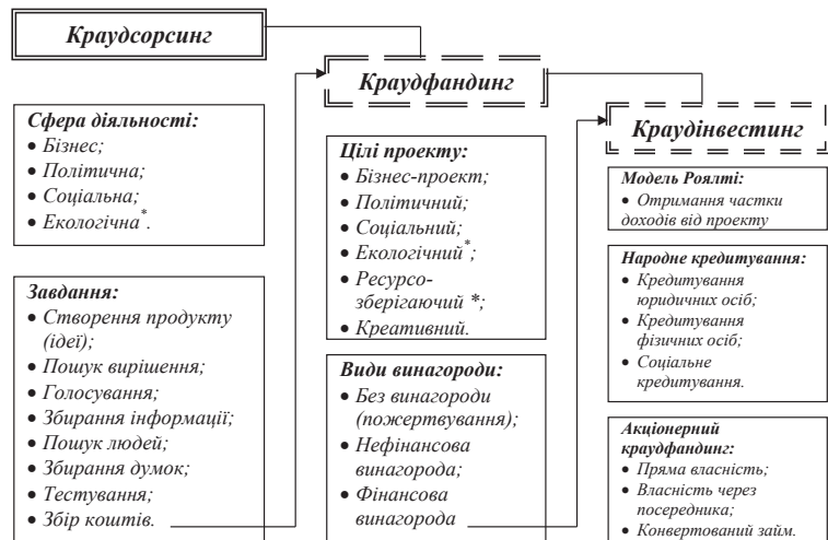
Рис. 2. Класифікація напрямів краудсорсингу

– великий обсяг охопту (території, спільноти та т. і.);