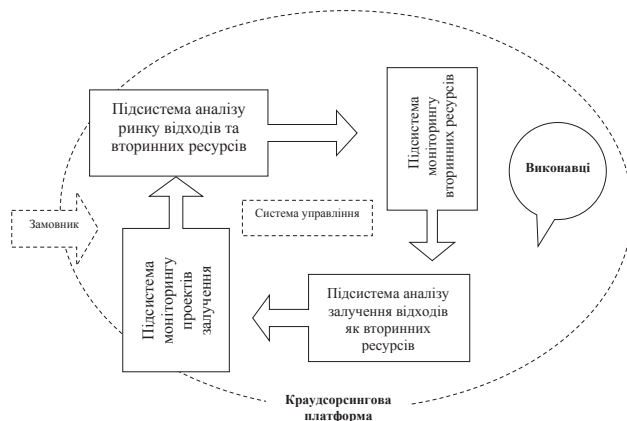
Рис. 3. Процес залучення відходів як вторинних ресурсів у виробництво на базі краудсорсингової платформи

У контексті сучасної концепції природокористування застосування краудсорсингової платформи допоможе в розвитку систем збереження природних ресурсів. Один з шляхів – це застосування у промисловому виробництві відходів та вторинних ресурсів. При залученні вторинних ресурсів в виробництво пропонується використовувати певний процес (рис. 3), що розглядається у вигляді системи, до складу якої входять декілька підсистем.