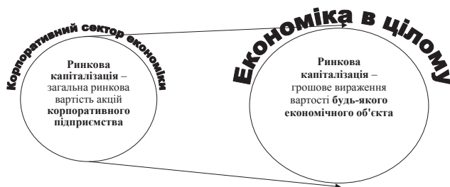
Рис. 2. Розширення меж наукового сприйняття поняття «ринкова капіталізація», як показника інвестиційної привабливості економічного суб'єкту

Саме тому, розглядаючи поняття капіталізації, як майнового показника інвестиційної привабливості, доречним є розширення його розуміння, від