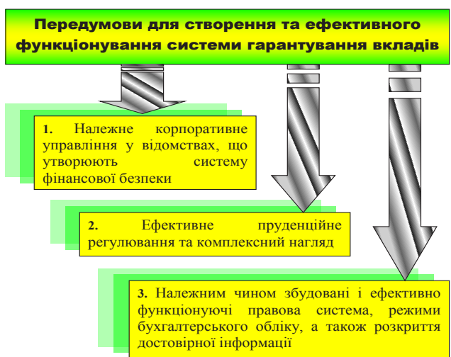
Рис. 1. Передумови впровадження систем гарантування вкладів*

Для імплементації схем захисту інтересів вкладників необхідний певний набір передумов, котрі хоча й знаходяться здебільшого за межами прямої компетенції органу системи гарантування вкладів, проте мають безпосередній вплив на ефективність її функціонування [8] (див. рис. 1).