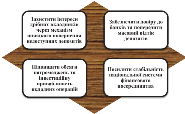
Рис. 2. Цілі створення механізмів гарантування вкладів

Враховуючи світовий досвід, можна виокремити, на нашу думку, наступні цілі [1, с. 15; 2; 5; 9; 10, с. 222; 11, с. 2], які спонукають країни впроваджувати власні схеми захисту вкладників (див. рис. 2):