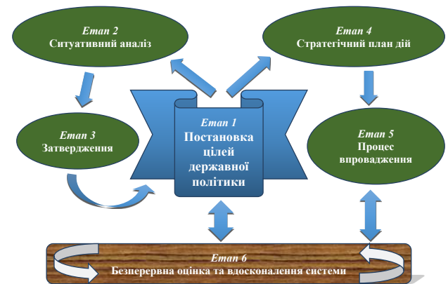
Рис. 4. Методика поетапного впровадження ефективної системи гарантування вкладів

Ініціативна група в рамках роботи Форуму фінансової стабільності розробила методіку, яка складається з шести кроків, що дозволяє органам влади поетапно ефективно розробляти, імплементувати та вдосконалювати механізми гарантування вкладів, враховуючи особливості фінансового середовища країни [2; 15; 16]. Для наочності ми відобразили їх схематично на рис. 4: