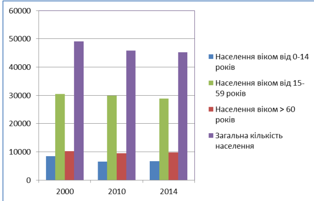
Рис. 1. Розподіл постійного населення за окремими віковими групами

У наступні роки ситуація з чисельністю дитячого населення почала дещо покращуватися. За станом на 1 січня 2014 року серед 45,246 млн осіб постійного населення нашої країни частка дітей віком 0-14 років становила 14,8% (6,711 млн дітей). Проте питома частка осіб похилого віку в останні роки почала збільшуватися (станом на 1 січня 2014 року становила 9,753 млн осіб – 21,6%) [1].