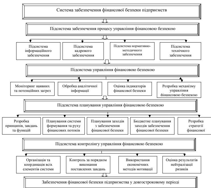
Рис. 1. Система управління забезпеченням фінансової безпеки підприємства

можливість прояву деструктивної дії різних факторів та умов на їх реалізацію в процесі фінансового розвитку і яка призводить до прямого чи непрямого економічному збитку» [1, с. 152]. Під загрозами В.В. Орлова розуміє сукупність умов, процесів, факторів, що перешкоджають реалізації пріоритетних фінансових інтересів підприємства [7, с. 268]. Функціонування агропромислових підприємств здійснюється в умовах посилення та загострення загроз різного характеру і походження. Вони кількісно взаємопроникають і функціонально взаємодію між собою. Загрози у техніко-технологічній сфері призводять до зростання рівня трудових витрат і зниженню фінансової результативності діяльності. Загрози у сфері несвочасної локалізації та розміщення фінансових потоків призводять до зниження рівня ліквідності та фінансової стабільності діяльності. У зв'язку з цим,