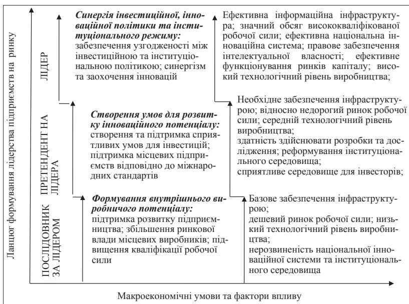
Рис. 1. Вплив макроекономічних факторів на формування лідерства підприємств на світовому ринку

Варто підкреслити, що згідно з класифікацією Ф. Котлера [1], будь-яке підприємство має певну стратегію розвитку, що характеризує його як послідовника за лідером, претендента на лідера або лідера світового ринку. У випадку, коли в країні спостерігається базове (транспортне та організаційне) забезпечення інфраструктурою, дешевий ринок робочої сили, низький технологічний рівень виробництва, нерозвиненість