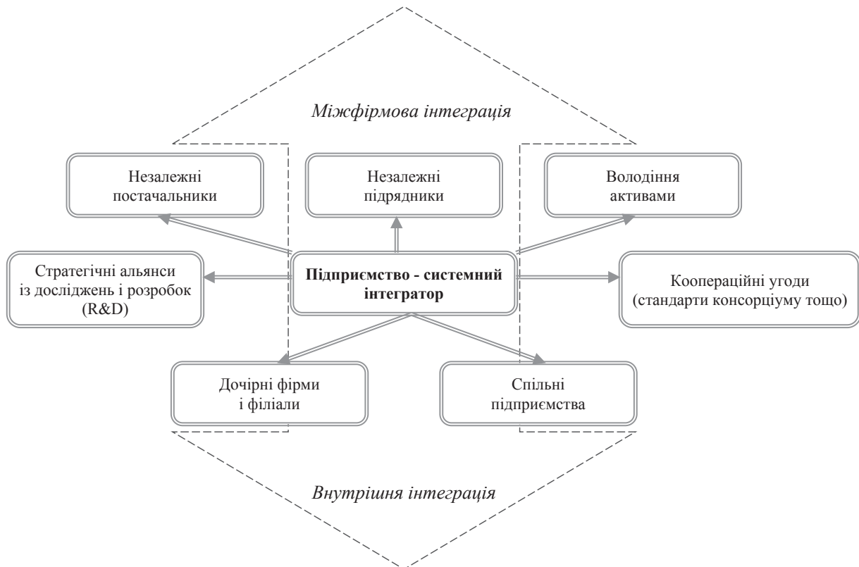
Рис. 1. Модель глобальної високотехнологічної промислової мережі

Зазначимо, що в рамках мережевої парадигми особливістю економічної інтеграції високотехнологічних підприємств є відхід від жорстких вертикальних ієрархічних систем організації виробництва та управління до гнучких партнерських відносин, та формування квазіінтегрованої структури виробництва, що являє собою сукупність самостійних підприємств і організацій. При цьому вони координують свою діяльність на основі мережевого принципу взаємодій і високого ступеня довіри, що характери-