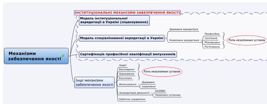
Рис. 2. Механізми забезпечення якості освіти – інституціональні зв'язки системи забезпечення якості вищої освіти