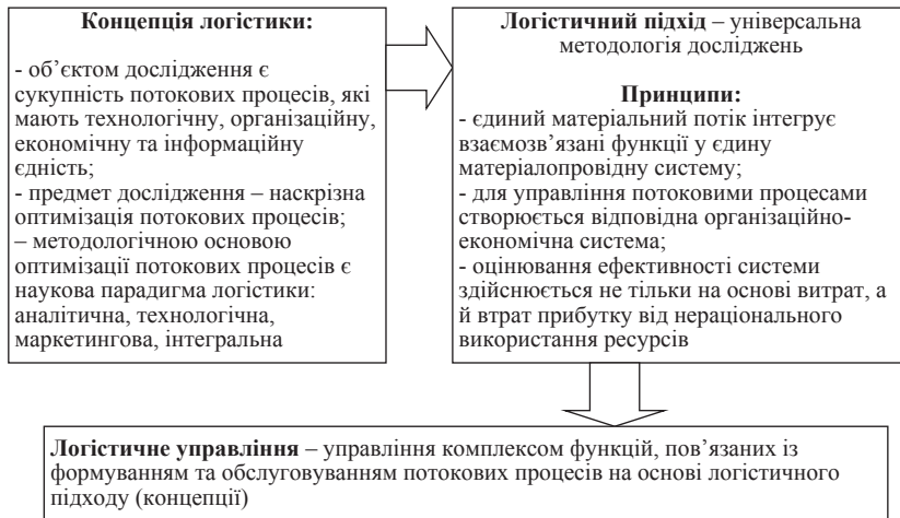
Рис. 1. Зв'язок основних категорій логістики [1, с. 27]

- Стратегія інтенсифікації економічних потоків забезпечує взаємодію регіональних логістичних центрів та регіональних органів влади щодо налагодження та управління рухом економічних потоків як на внутрішньо-регіональному, так і на міжрегіональному рівнях.