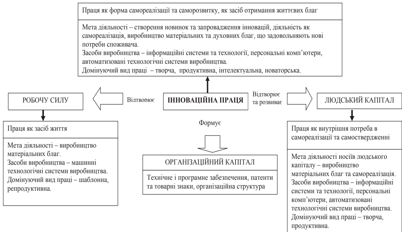
Рис. 2. Інноваційна праця як можливість відтворення та розвитку людського капіталу